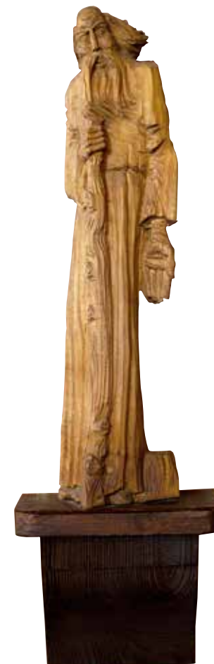
Mose schlägt Wasser aus dem Stein. Skulptur aus Polen in der Johanneskirche.