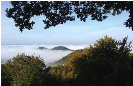
Drachenfels und Wolkenburg im Morgennebel