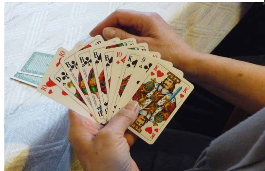
Spielvergnügen am Dienstagnachmittag

Die Konversationsgruppen Französisch und Englisch , die am Montag um 14.00 Uhr im Wechsel stattfinden, können im Moment keine neuen Mitglieder aufnehmen. Es lohnt sich aber durchaus, auf einen frei werdenden Platz zu warten, denn gelegentlich scheidet doch jemand aus. Sprechen Sie die Gruppenleiterinnen Inge Lent (Französisch) oder Cornelia Fricke (Englisch) an.