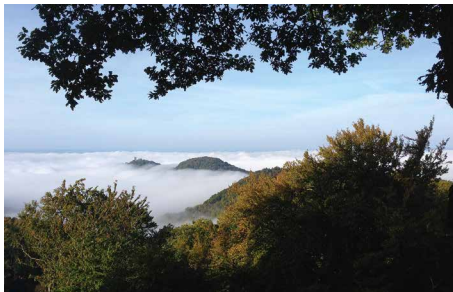
Drachenfels und Wolkenburg im Morgennebel