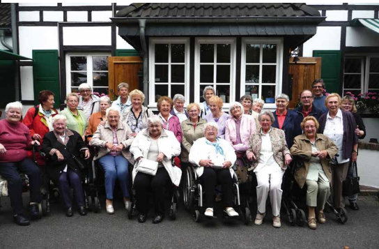
Ausflug des Frauenkreises nach Altenberg