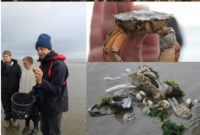
Segeln 2019 – Wind, Meer, Inseln, Natur und – WIR!