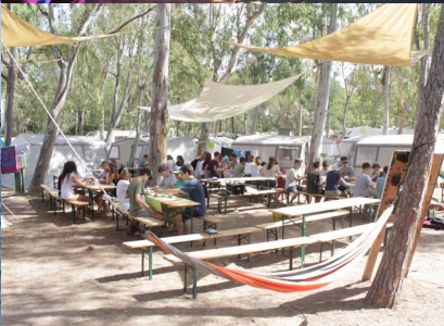
Sardinien 2019 – traumhaftes Meer, Gemeinschaft, Sonne & WIR!